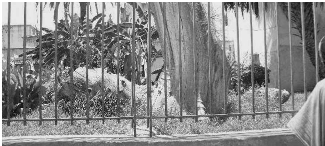
Derrière les barreaux.

A l'entrée du tribunal, les observateurs se sont vus retirer leurs téléphones mobiles. Certains ont été fouillés. Par contre ce même accès au tribunal a été autorisé à des personnes portant le drapeau marocain ou le portrait du roi. Elles avaient le droit d'avoir un portable et s'en servaient sans gêne devant les policiers.