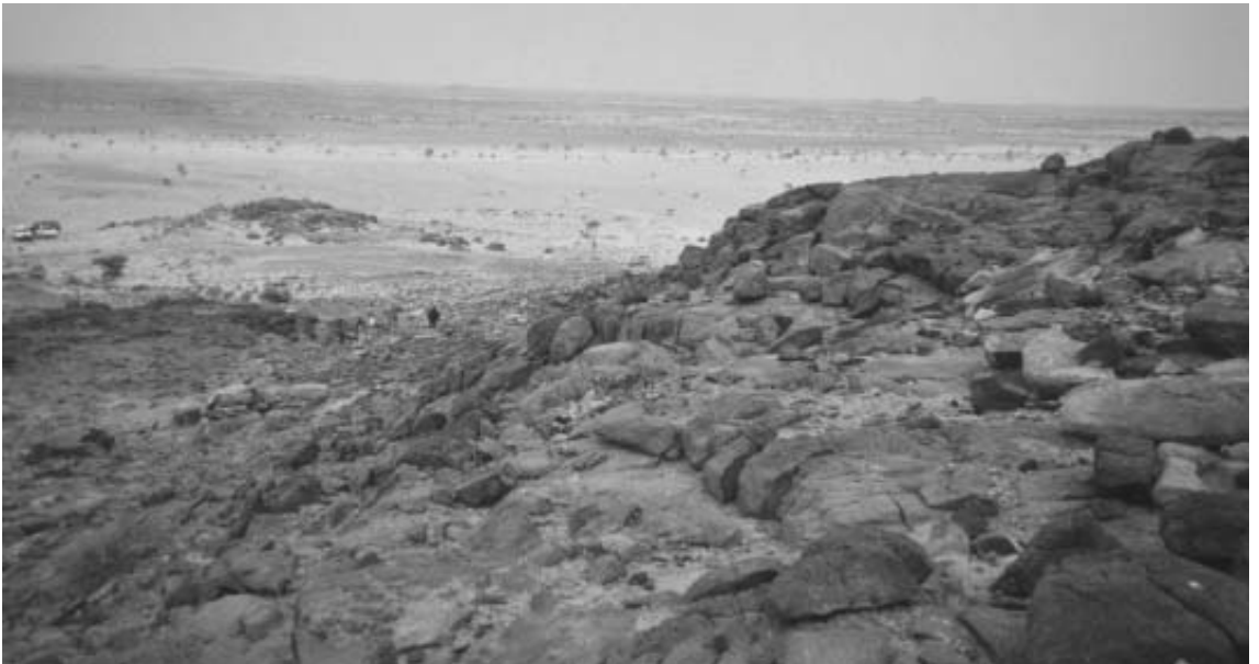
100 kilomètres de désert.

soldats sahraouis de l'armée espagnole. Et El Ghezouali? Il a mené par la suite de nombreuses opérations militaires contre l'armée espagnole puis contre l'armée marocaine, qui a envahi, en octobre 1975, le Sahara Occidental évacué par l'Espagne quelques mois auparavant. Son coup de feu, bien qu'involontaire, l'a fait entrer dans l'histoire du peuple sahraoui.